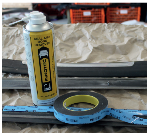
Montering af lister