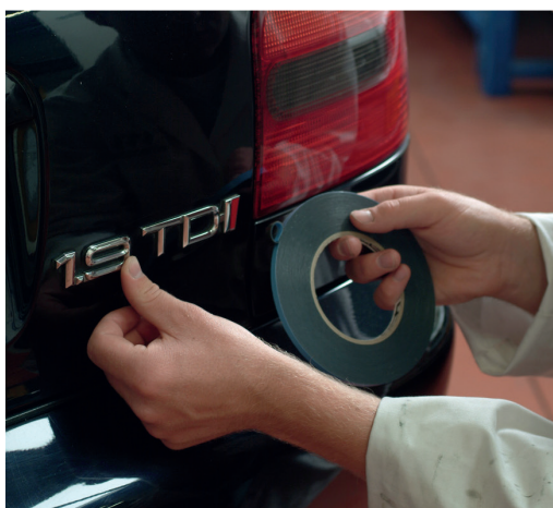
Montering af skilte